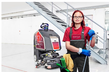
Cobotics in der Unterhaltsreinigung