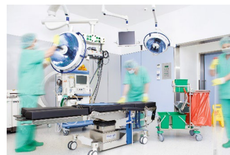
Healthcare Hygienereinigung OP- Saal