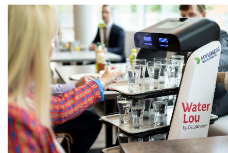
Serviceroboter Water Lou