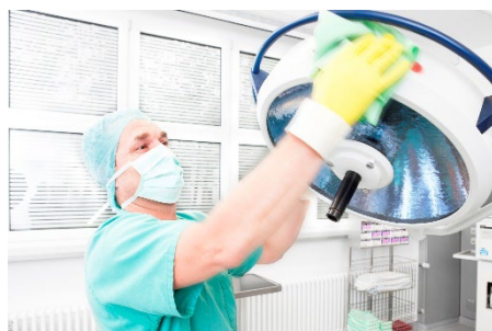
Healthcare Hygienereinigung OP- Saal