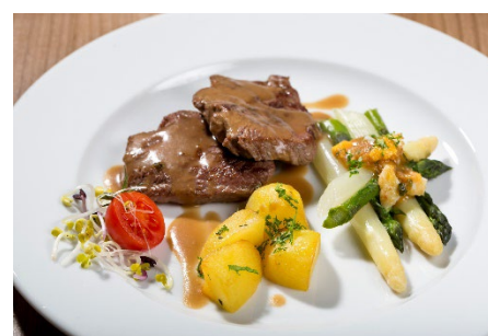
Health Catering