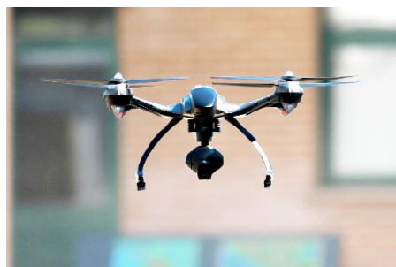
Drohnen im Sicherheitsdienst